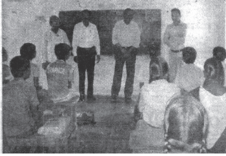
విద్యాపక్షోత్సవాలలో ఆదిలాబాద్ జిల్లాలో పాల్గొని అభ్యాసకులతో చర్చిస్తున్న డైరెక్టర్