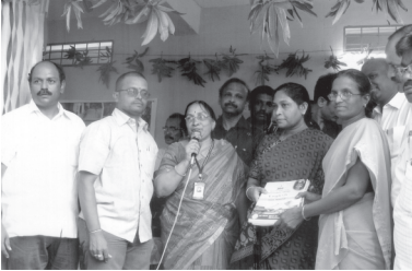
తిరువూరు ఎమ్మెల్యే దిరిశం పద్మజ్యోతి గారిచే అభ్యాసకులకు పుస్తకాల పంపిణీ - కృష్ణాజిల్లా.