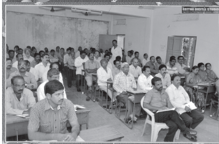
ఓరియంటేషన్ కార్యక్రమంలో పాల్గొన్న A.I కో ఆరినేటర్లు