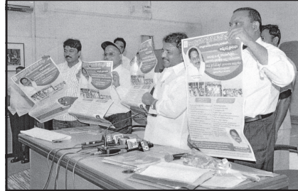
2012-13 APOSS ప్రాస్యెక్టస్ ట్రోచరీను విడుదల చేస్తున్న మంత్రివర్యులు డా|| ఎన్. శైలజానాథ్ గారు