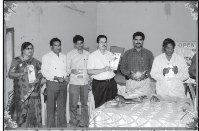
మెదక్ లో ఓరియెంటేషన్ కార్యక్రమంలో భాగంగా వృత్తివిద్యాకోర్సుల ట్రోచరీను విడుదల చేస్తున్న దృశ్యం

అయితే వృత్తివిద్యా కోర్సులో చేరదలచుకున్న అభ్యాసకులు Group-C గా కాని, SSC బేసిక్ / అడ్వాన్స్డ్ కోర్సుల్లో వారికి వీలున్న A.I. లో చేరవచ్చు. వారికి VTC /లను APOSS - Hyd వారే కేటాయిస్తారు. SSC & Intermediate, field certificate 49 సబ్జెక్టులు ఉండగా, ఇప్పటివరకు 25 సబ్జెక్టులకు కరిక్యులమ్ వర్కషాపులు నిర్వహించబడినాయి.