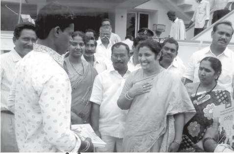
ప్రకాశం జిల్లాలో కేంద్రమానవవనరుల శాఖామంత్రి గౌ|| విద్యాపక్షోత్సవాలలో ఆదిలాబాద్ జిల్లాలో పాల్గొని పురందరేశ్వరి గారు APOSS అభ్యాసకులకు పుస్తకాలు పంపిణీ చేస్తున్న చిత్రం