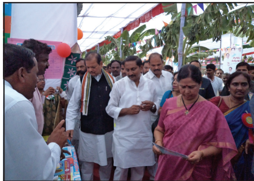
చిత్తూరుజిల్లా తిరుపతిలో విద్యాపక్షోత్సవాల్లో పాల్గొని ఓపెన్ స్కూల్ క్యాంపసు పరిశీలిస్తున్న ముఖ్యమంత్రి కిరణ్ కుమార్ రెడ్డిగారు మరియు మంత్రివర్యులు డి.కె. అరుణ, పార్లమెంటు సభ్యులు.

ఆధునిక విజ్ఞాన సమాజంలో విద్యావంతులుగా మారడానికి నూతన పంథాలో ఎన్నో అవకాశాలు కల్పిస్తున్న ఓపెన్ స్కూల్ ను సద్వినియోగం చేసుకొని, జీవితంలో పురోగమనాన్ని సాధించాలని కోరుకుంటూ, అభ్యాసకులను స్వాగతిస్తున్నాం.